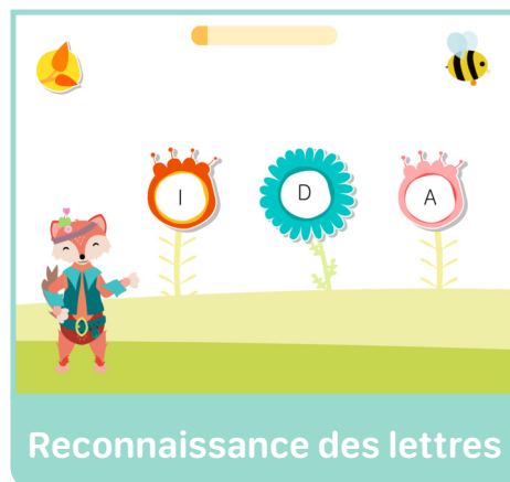
Reconnaissance des lettres