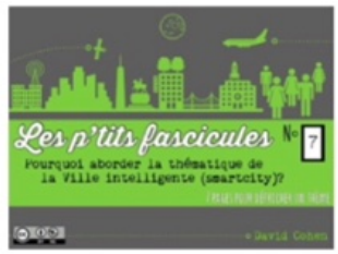
7/ Smart city maker

! DÉJÀ 9 OPUS 7 NUMÉROS + 2 HORS-SÉRIE MERCİ DE VOTRE SOUTIEN 🙏