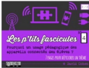
4/ BYOD 2/2