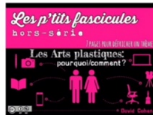
2/ Arts plastiques