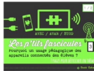
3/ BYOD 1/2