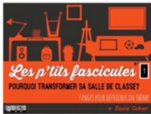
1/ espaces scolaires