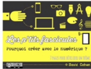
5/ créer avec le numérique