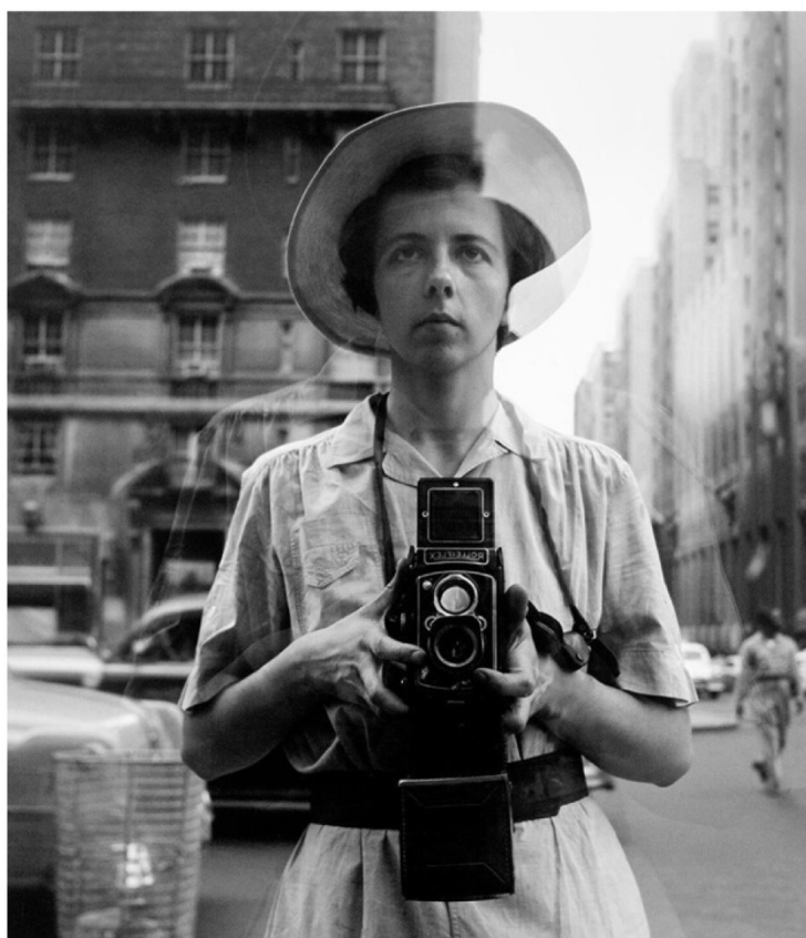
Vivian Maier Autoportrait non daté (épreuve Argentique)

Dossier photographie numérique « du capteur à l'image »