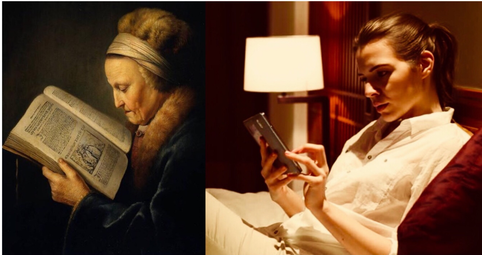
Rembrandt, vieille femme lisant 1631, huile sur toile (60x48 cm)