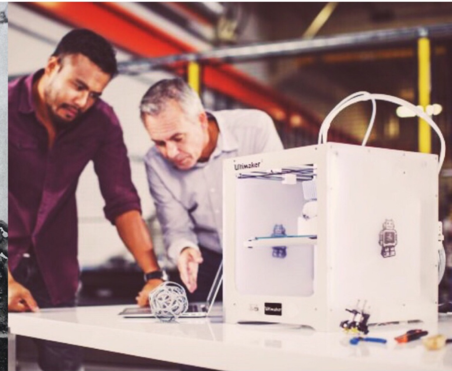
Utilisation de l'Ultimaker 3 « UM3 » en 2017