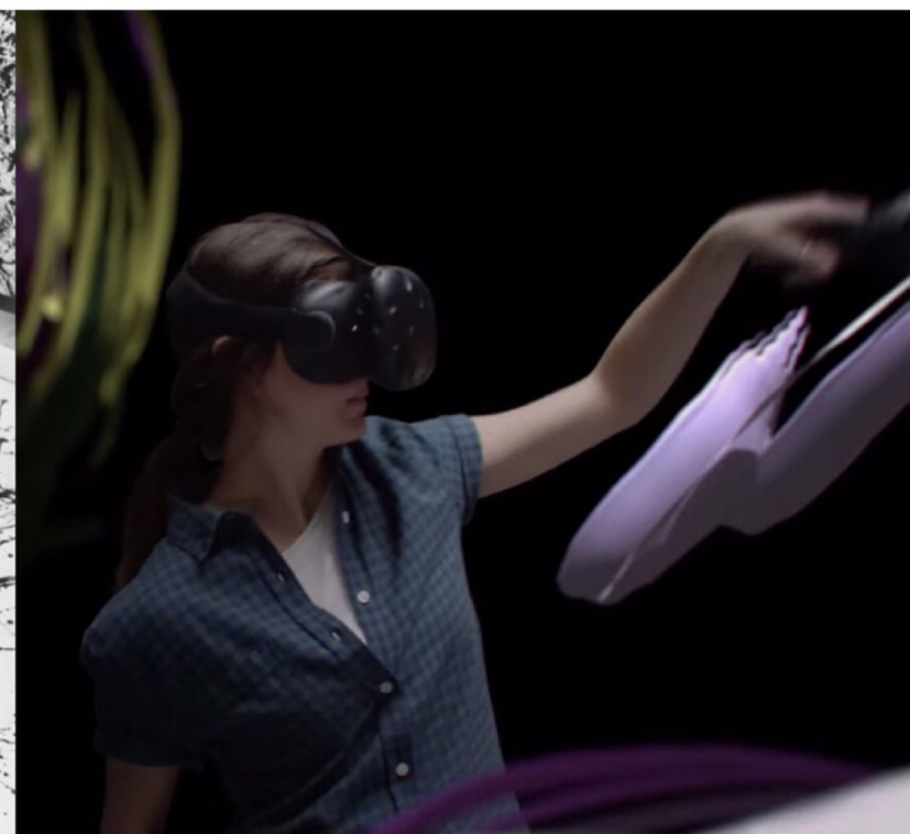
Utilisation de Google Tilt Brush (VR) 2017