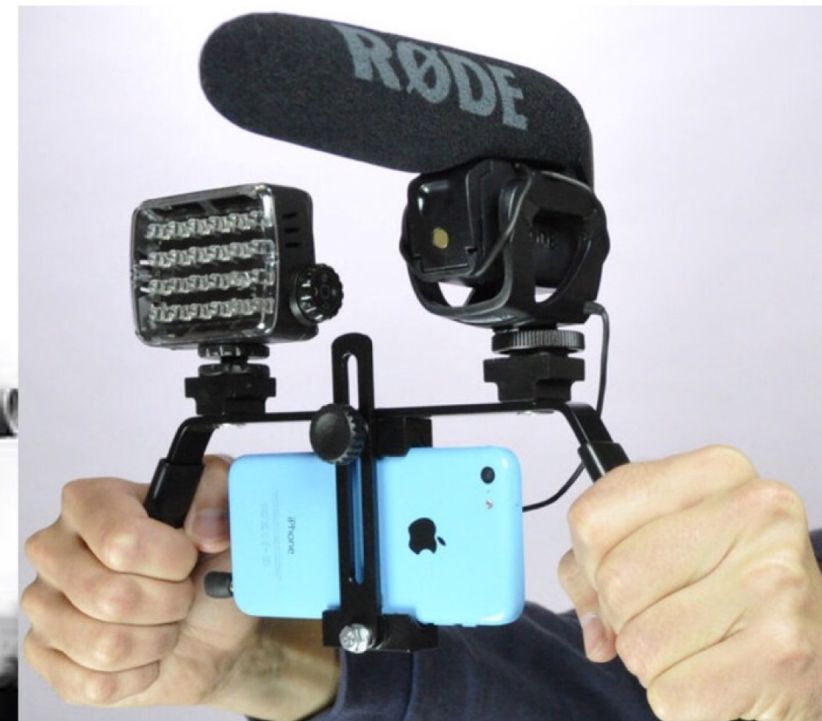
videonline.info (p.13) Tutoriel filmer comme un pro avec son smartphone 2016