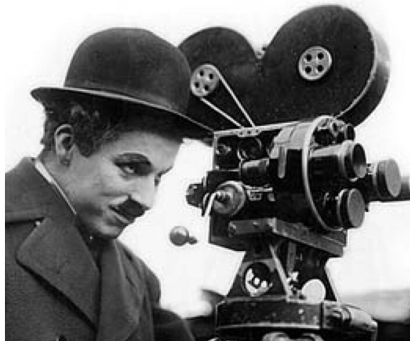
Charlie Chaplin avec sa caméra Bell & Howell modèle 2709 1925

MOOC « réaliser des vidéos pro avec son smartphone »