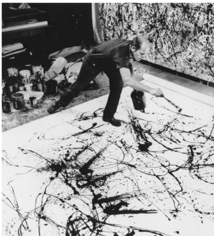
Jackson Pollock dans son atelier en 1947