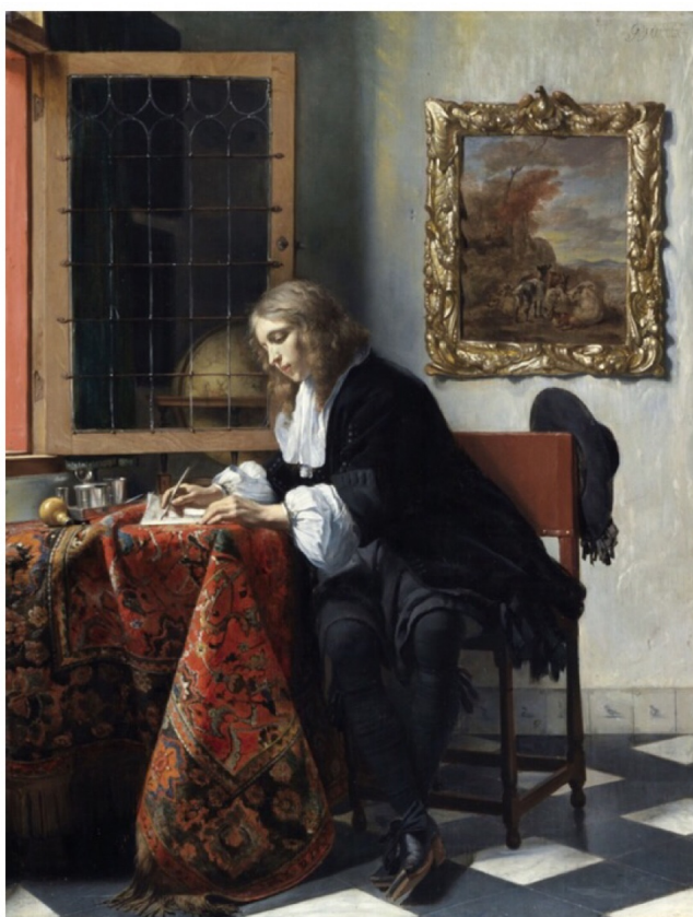
Gabriel Metsu, jeune homme écrivant une lettre 1662, huile sur toile (52x40 cm)

La transformation numérique pousse à repenser les espaces de travail